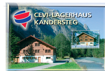
( unser Freizeithaus )

Wir haben uns bemüht die Reisekosten so gering wie möglich zu halten. Teilnehmer die aus wirtschaftlichen Gründen nicht in der Lage sind den gesamten Betrag zu bezahlen, können eine Beihilfe beim Jugendamt der Stadt Marl beantragen. Informationen gibt es auch bei uns.